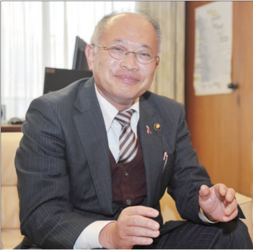
葛城市長 阿古和彦氏